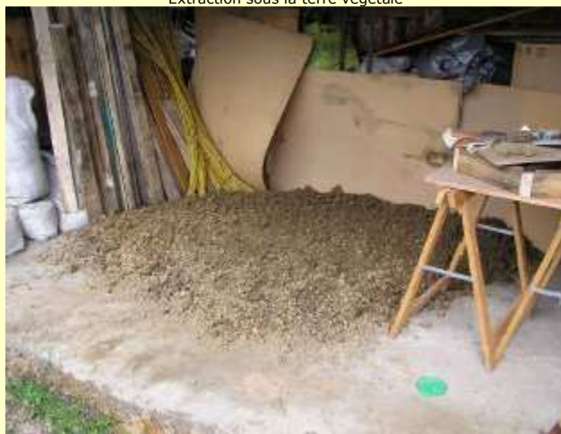
Argile avant tamisage