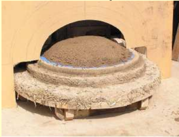
Utilisation du gabarit