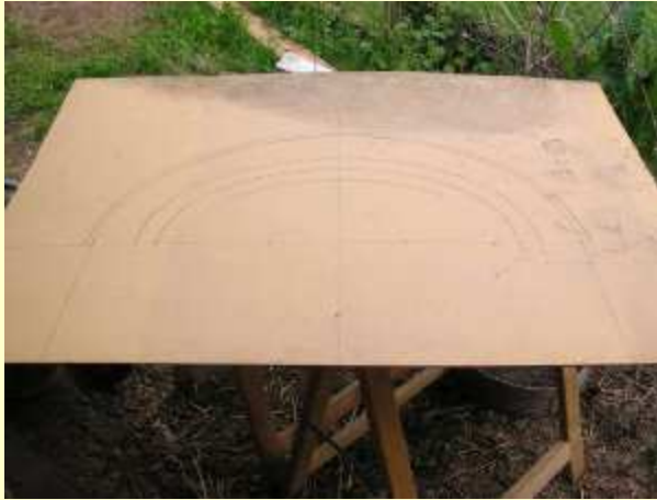
Traçage du gabarit