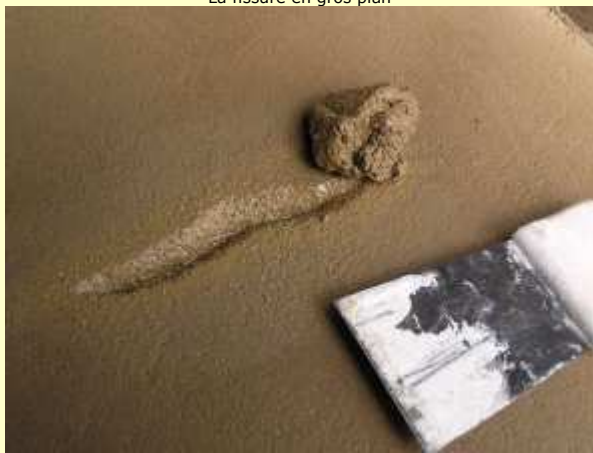
Rebouchage de la fissure