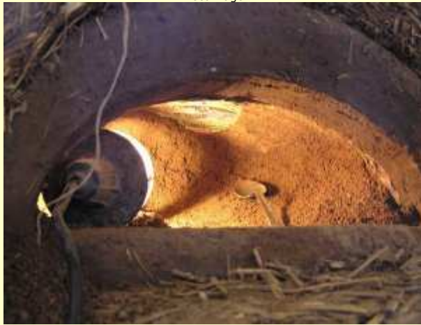
Evacuation du dôme de sable