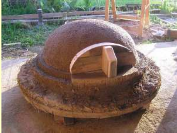
Dôme de sable et porte