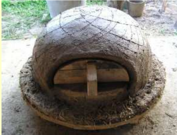
Quelques stries pour l'accroche