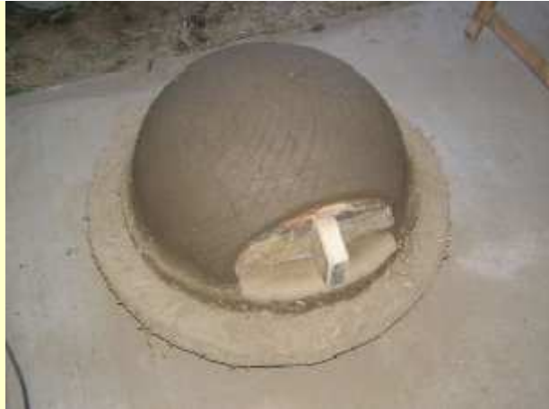
Quelques stries pour l'accroche