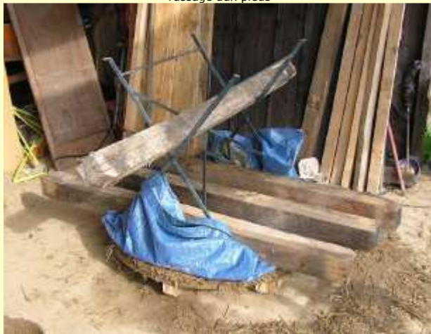
Tassage à la table de jardin !