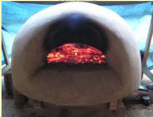
Premier gros feu après un long séchage et petits feux préliminaires