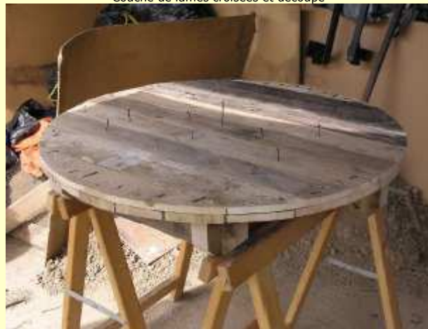
Quelques clous pour l'accroche de la couche paille-terre