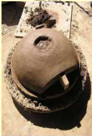
Tasser et lisser fortement à la truelle