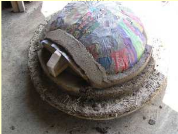
Début de la couche terre-sable