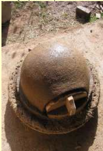
Barbotine juste avant la couche terre-paille