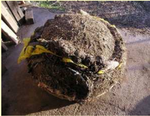
Coffrage devant la porte et début de la couche paille-terre