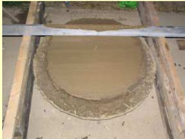
Barbotine et mise à niveau