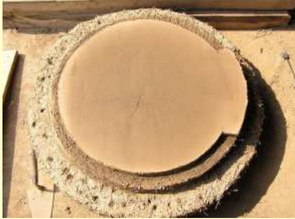
Une fissure lors du séchage