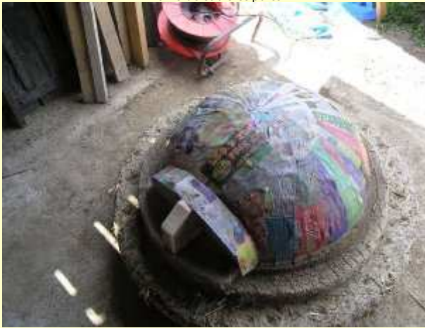
Couche de papier