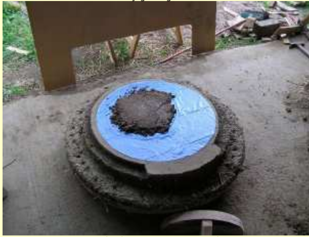
Sur le plastique, je commence le dôme en sable+eau argileuse