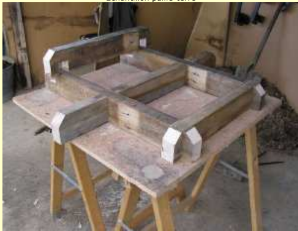
Assemblage structure à mi-bois