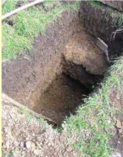
Extraction sous la terre végétale