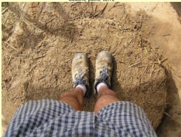
Tassage aux pieds