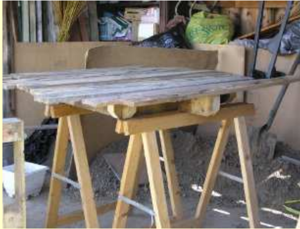
Plateau en lames de palette