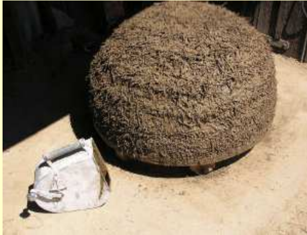
Passage de la tyrolienne avant l'enduit final