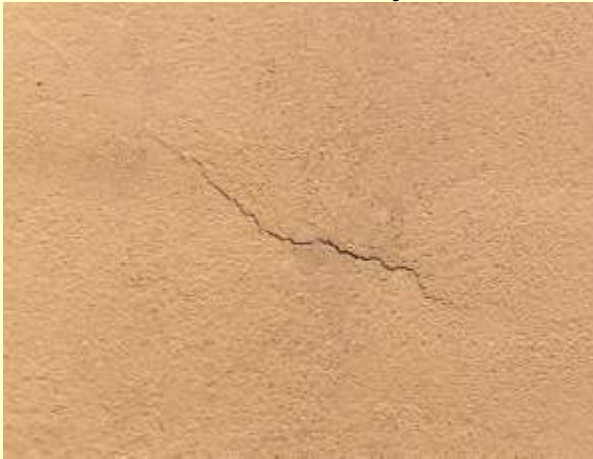
La fissure en gros plan